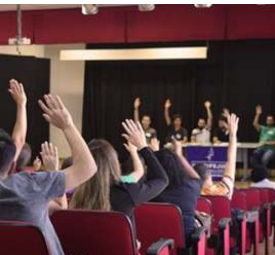
Assembleia no IF Sudeste MG

O Sindicato é coordenado por uma Diretoria Executiva, que contém 20 membros efetivos e 6 suplentes. O mandato é de 3 anos e os membros dividem-se em dez coordenações: Coordenação geral; Organização política e sindical; Educação e formação sindical; Administração e finanças; Comunicação sindical; Assuntos jurídicos; Saúde; Esporte e Lazer; Atividades Culturais; Aposentados.