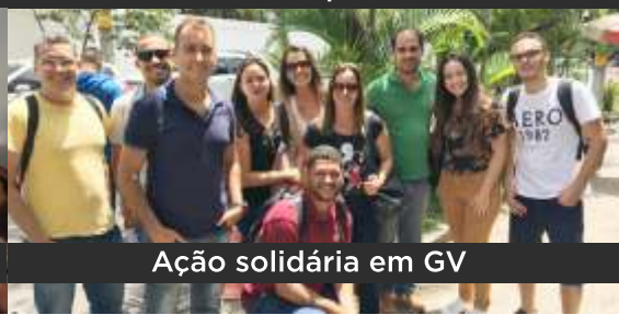
Ação solidária em GV