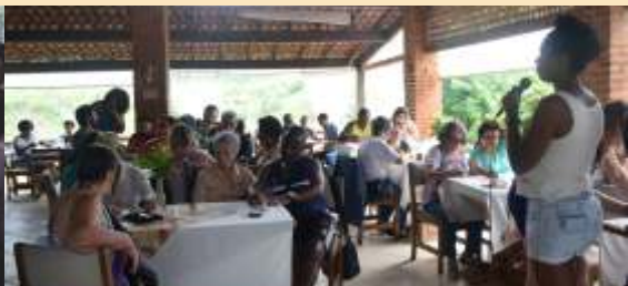
Passeio dos aposentados