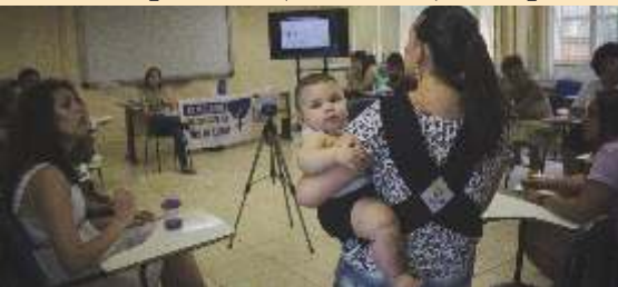
Março de luta das mulheres

Contrapartida ( subsídio ) nos planos de saúde.