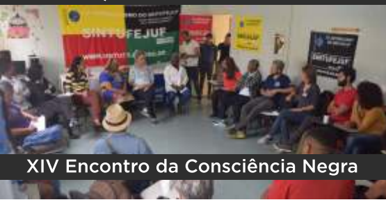
XIV Encontro da Consciência Negra